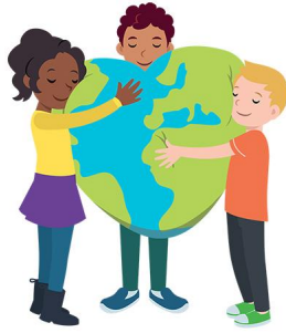
We hebben hart voor elkaar

De komende periode gaan de lessen van de Vreedzame school over gevoelens. De kinderen leren gevoelens te herkennen en ermee om te gaan. Om kunnen gaan met gevoelens is van groot belang voor een positief klimaat in de klas en in de school.